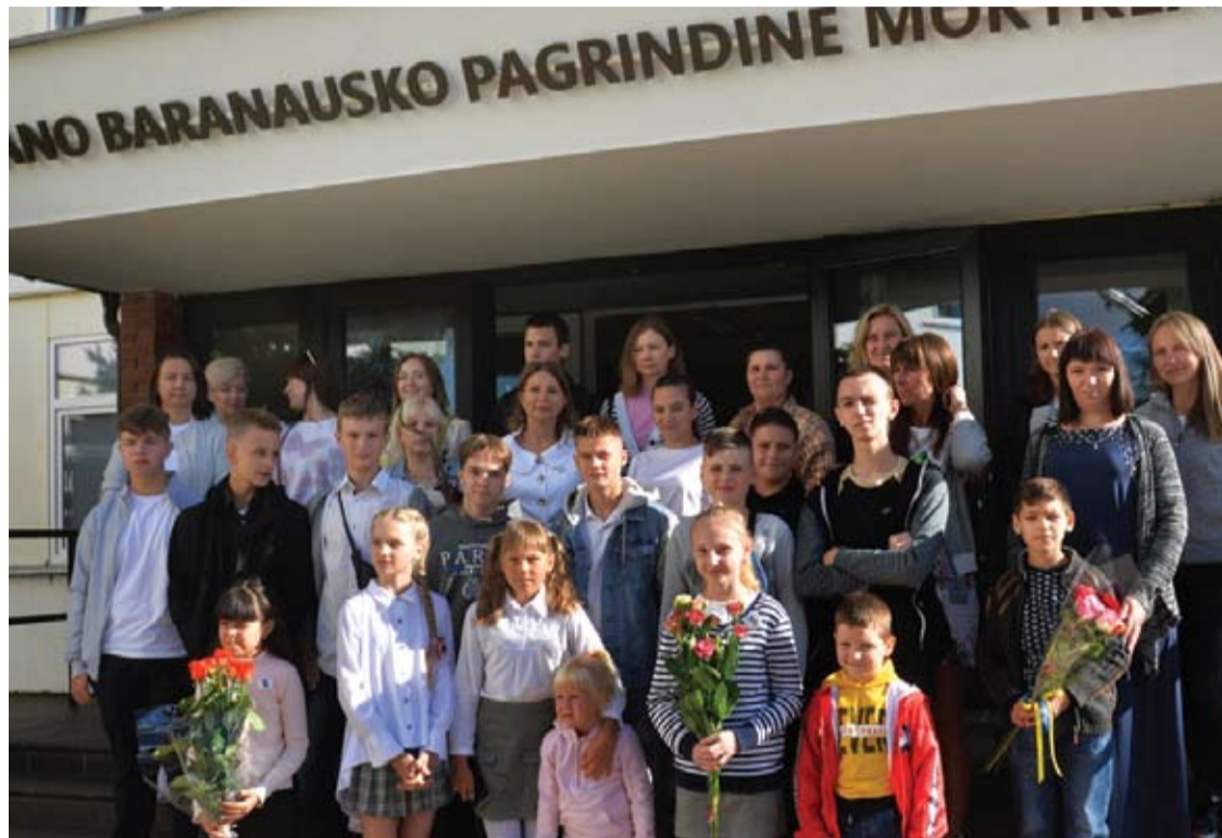
Anykščių Antano Baranausko mokykloje mokosi 47 ukrainiečiai.

Vasarą vienos ukrainiečių šeimos iš Anykščių išvažiavo, kitos atvažiavo. Tačiau tas pusšimtis ukrainiečių stabilizavo Anykščių rajono mokyklų mokinių skaičių.