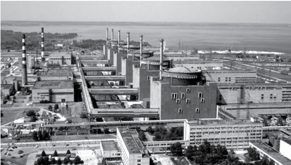
Zaporizės AE.

Vyriškis paprašė neminėti jo pavardės, mat maskolių okupuotame Energodare liko gyventi jo žmona, o Zaporizės AE vieno skyriaus vadovu liko dirbti metais jaunesnis jo brolis.