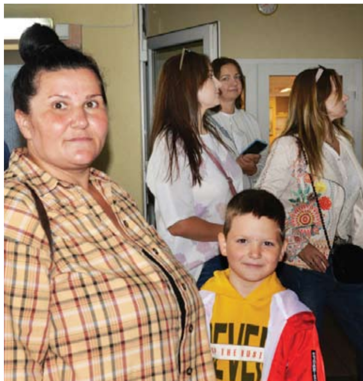
Rugsėjo 1-ąją į mokyklą mamos atlydėjo savo vaikus.

Į paralelines klases jie skirstomi maždaug po lygiai, stengiamasi, kad kiekvienoje klasėje būtų po kelis vaikus iš Ukrainos, nes jiems taip jaučiau. Su mokytojais ukrainiečiai bendrauja rusiškai ir angliškai, su mokiniais - angliškai. Jaunieji lietuviai rusų kalbos nemoka, o angliškai bando šnekėti jau nuo pirmųjų klasių, tad ukrainiečių buvimas Anykščiuose mūsų vaikams padeda lavinti užsienio kalbos įgūdžius.