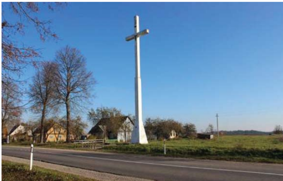
Betoninis kryžius šalia Kavarsko dar šiemet bus apšviestas.

Robertas ALEKSIEJŪNAS robertas.a@anyksta.lt