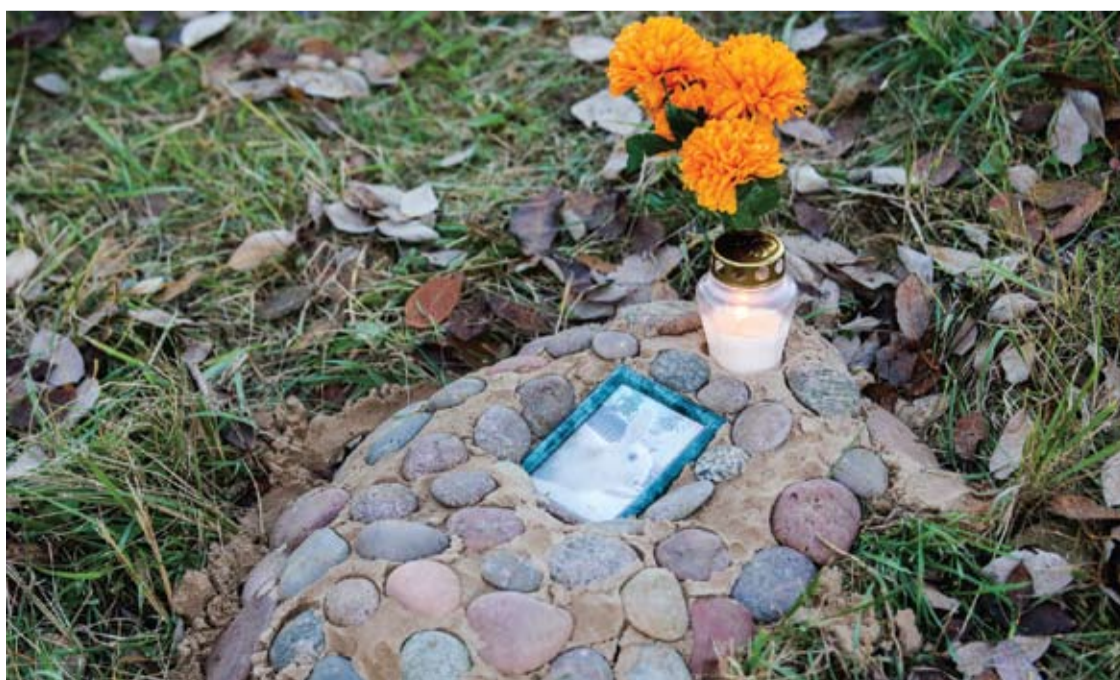
Anykštėnai savo augintinius galės laidoti civilizuotai.

Anykščiuose planuojamų įrengti naminių gyvūnų laidojimo vietų aptvėrimo ir sutvarkymo darbus atliks UAB „Anykščių komunalinis ūkis“. Su bendrove Anykščių rajono savivaldybė pasirašė kiek daugiau nei 7 tūkst. Eur sutartį.