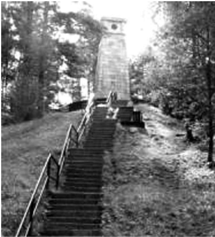
„Laimės žiburio“ paminklą skaitytojai ragina pirmiausia ne apšviesti, o sutvarkyti, nes jis yra apleistas.