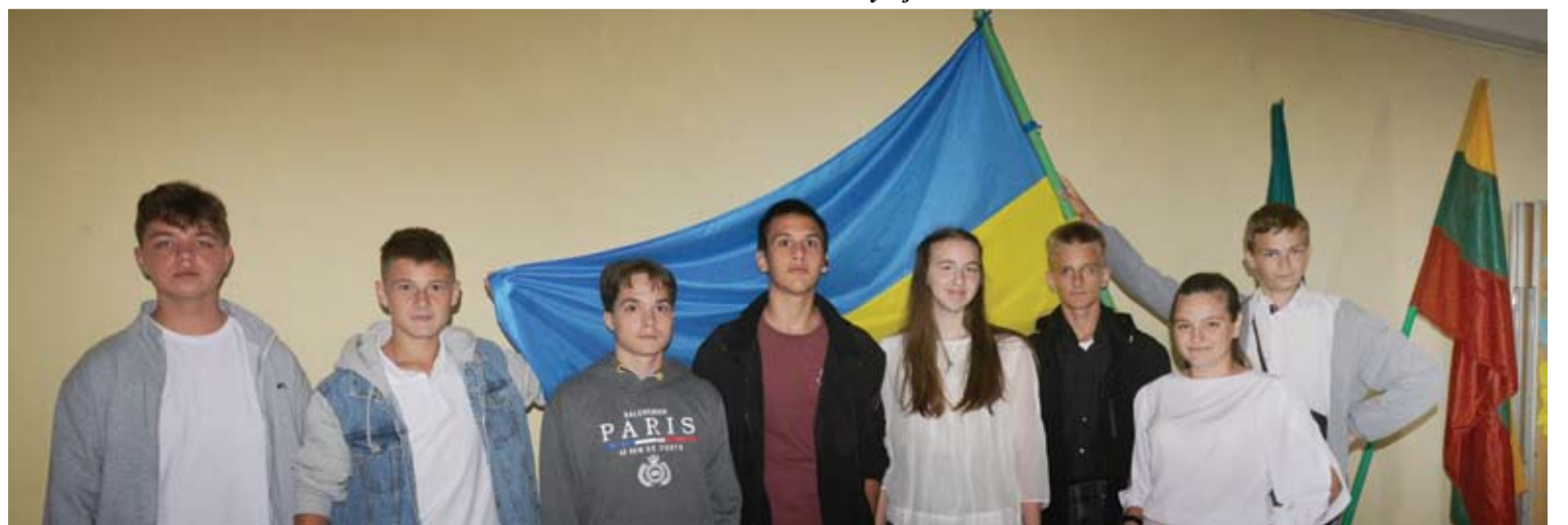
Ukrainos pabėgėlių palaikymas vis dar juntams mokyklų koridoriuose.